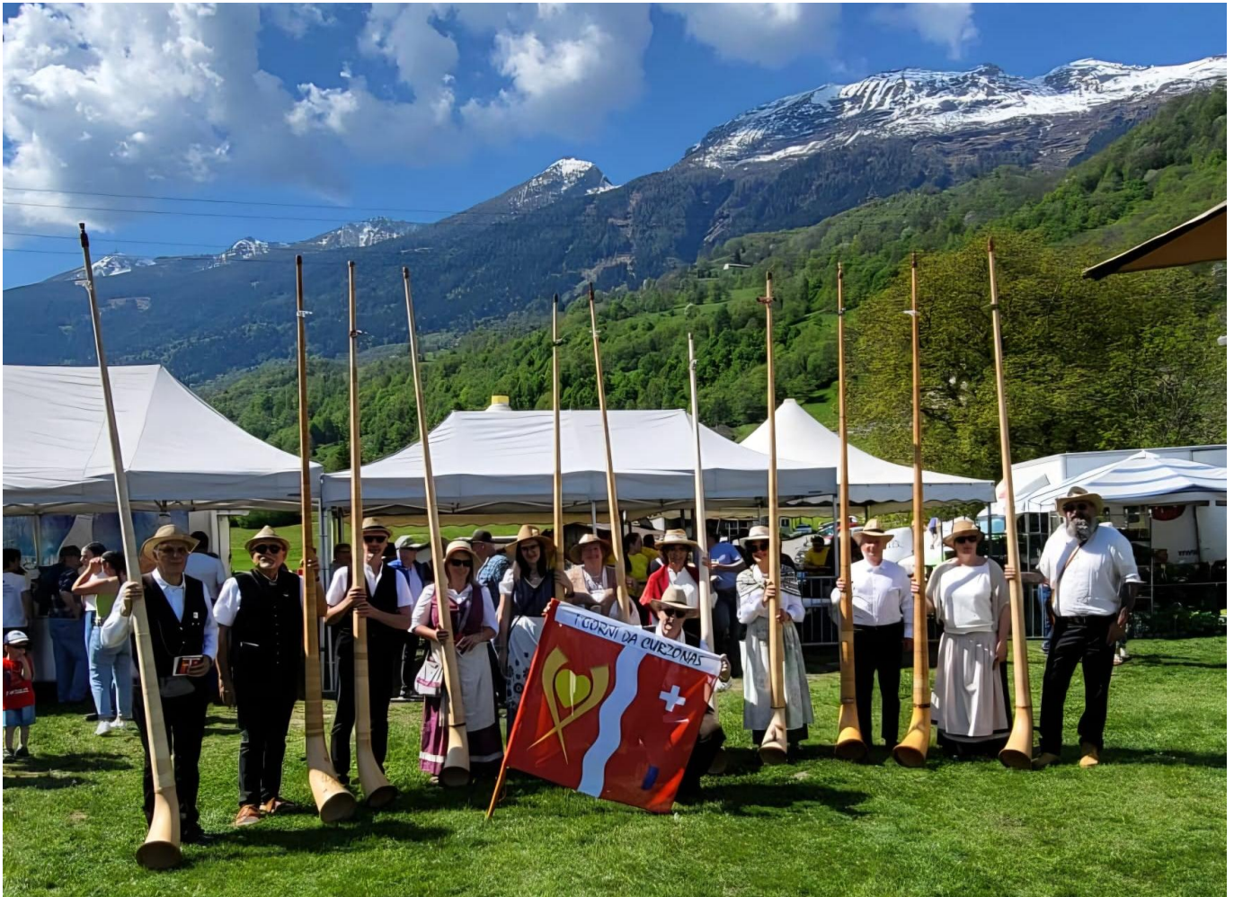
Groupe de cors des Alpes « I corni da Corzönas »